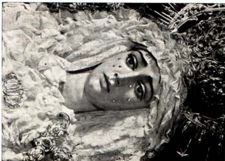
MARIA SANTISIMA DE GUADALUPE Capilla de Nuestra Señora del Rosario Calle Dos de Mayo - Sevilla