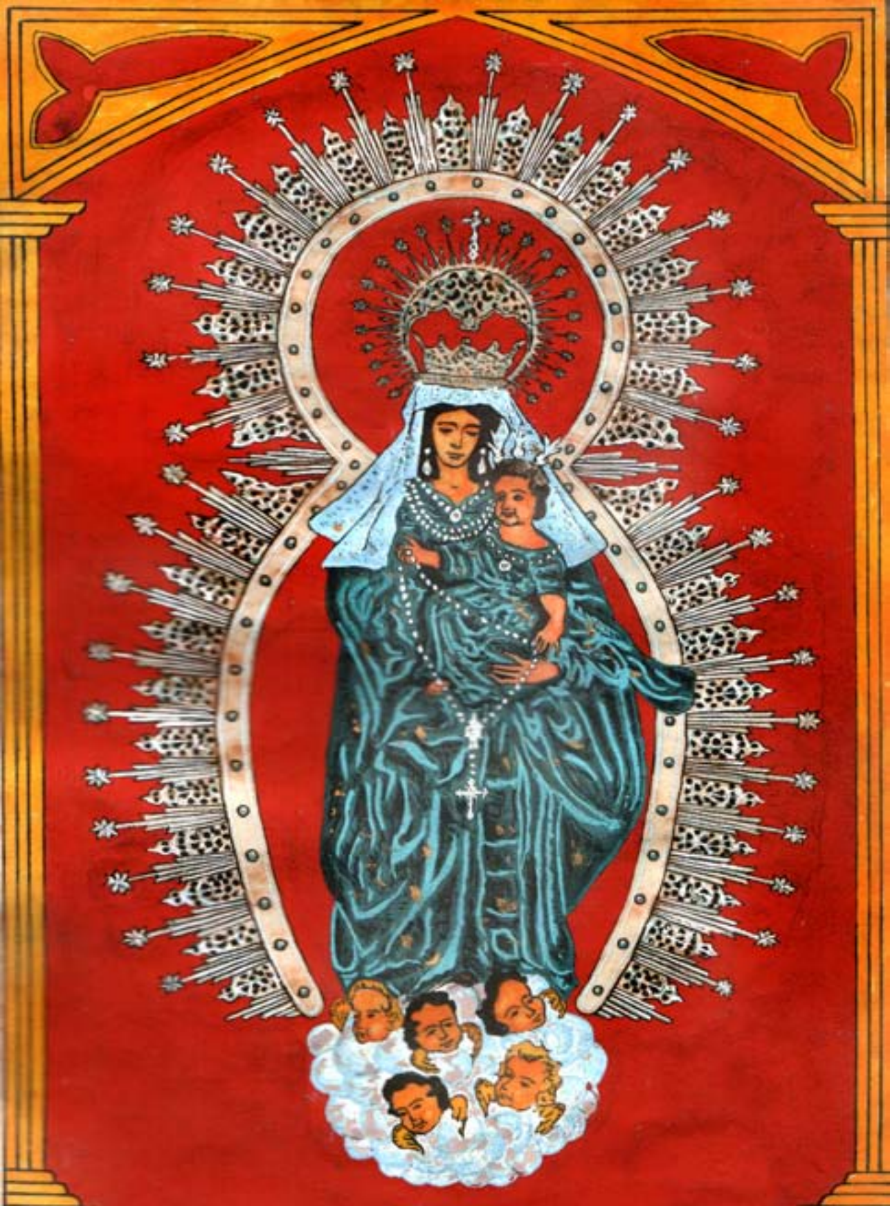
Reproducción del Libro de Reglas de la Hermandad de Ntra. Sra. de Rosario