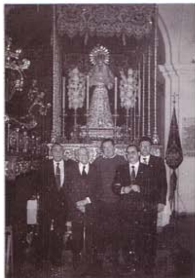
Sevilla, 10 de Abril de 1994