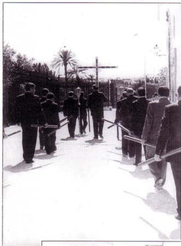
Hermanos con cirio tras la Cruz de Guía, camino de la Real Maestranza de Caballería.