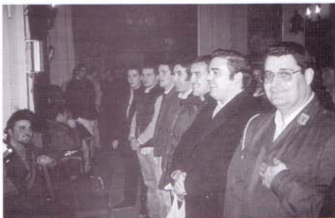
Costaleros en el momento de la «igualá»

En mi modesta opinión y sin querer faltar al respeto de nadie, las motivaciones de fe o devoción por sí solas no valen de nada debajo de un paso, a ésta hay que unir unas buenas condiciones físicas y conocimiento de las técnicas del oficio y por último, hay algo muy importante para mí, que es la cabeza; si la cabeza no funciona es imposible superar ciertos momentos duros que tarde o temprano siempre aparecen. Estas condiciones unidas a la formalidad y la disponibilidad para trabajar deben de ser las características de un buen costalero.