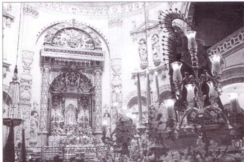
El paso de Nuestra Señora del Rosario ante la Virgen de los Reyes