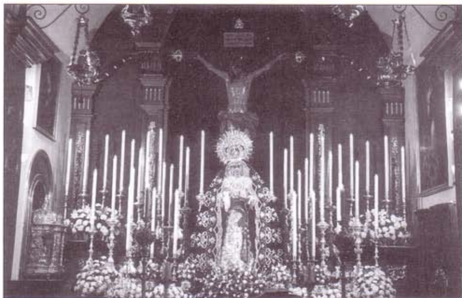
Altar del Triduo a María Santísima de Guadalupe