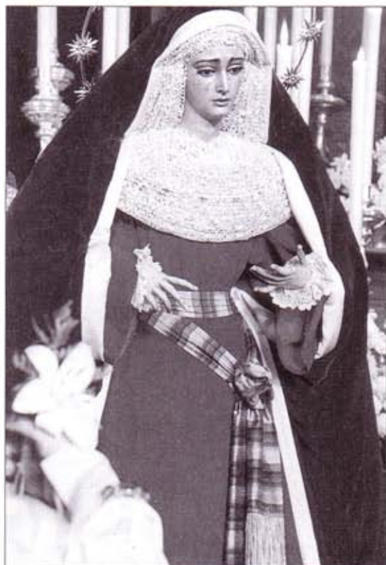
María Santísima de Guadalupe durante su Besamanos