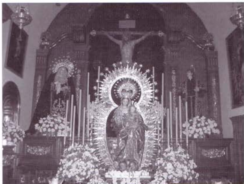
Triduo a Ntra. Señora del Rosario