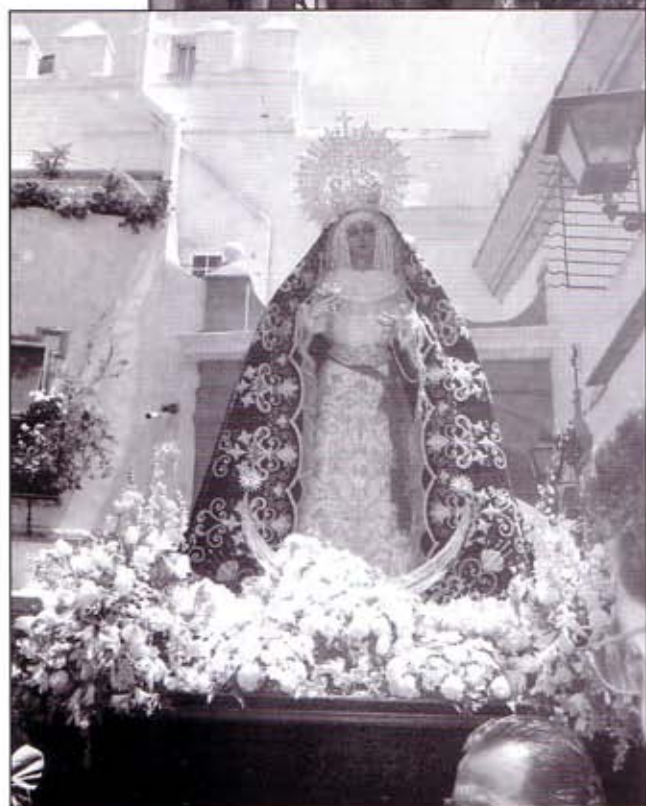
Distintos momentos del Rosario Público celebrado el pasado 16 de mayo con la imagen de María Santísima de Guadalupe por las calles de nuestra feligresía.