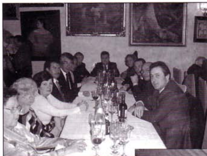
Comensales en el almuerzo de Hermandad celebrado el domingo 7 de marzo en el Mesón Don Raimundo.