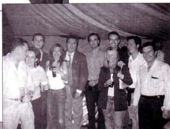
Grupo de asistentes a la Cruz de Mayo.