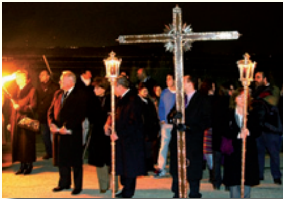
Vía Crucis del Aljarafe