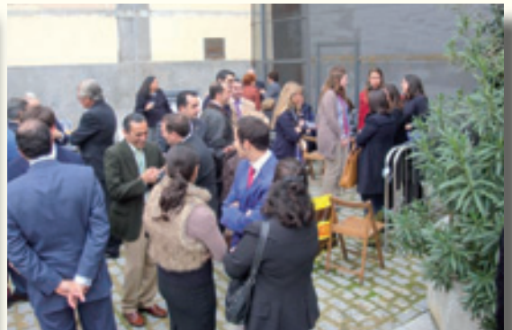
Convivencia tras la Función de Guadalupe