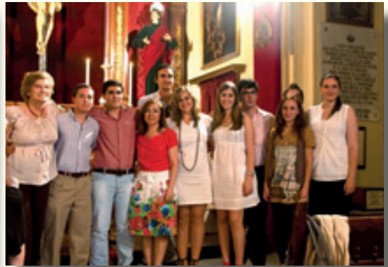
Entrega de premios de la II Gymkhana Cofrade