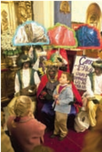
Visita del Cartero Real