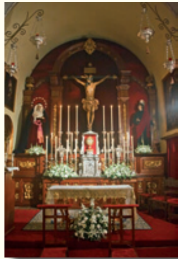
Jubileo Circular de las 40 horas