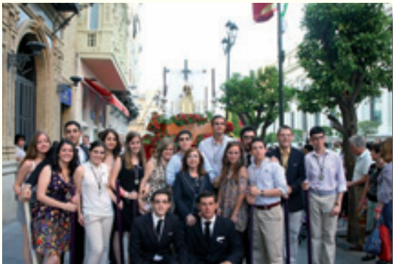
Cruz de Mayo