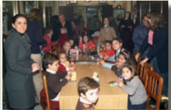
Actividades con el Grupo Infantil