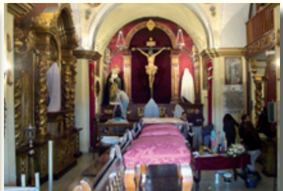
Limpieza general de la Capilla