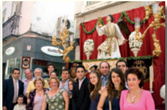
Altar del Corpus de la Hermandad