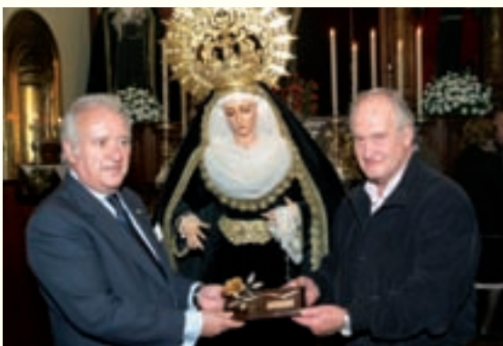
Regreso María Santísima de Guadalupe