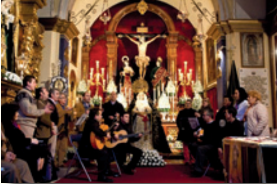
Coro Campanilleros Besamanos