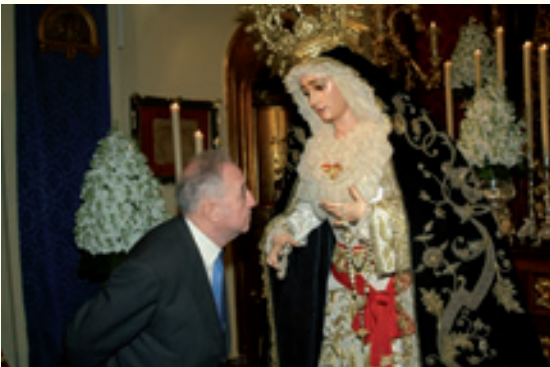
Misa por las intenciones del Pregonero